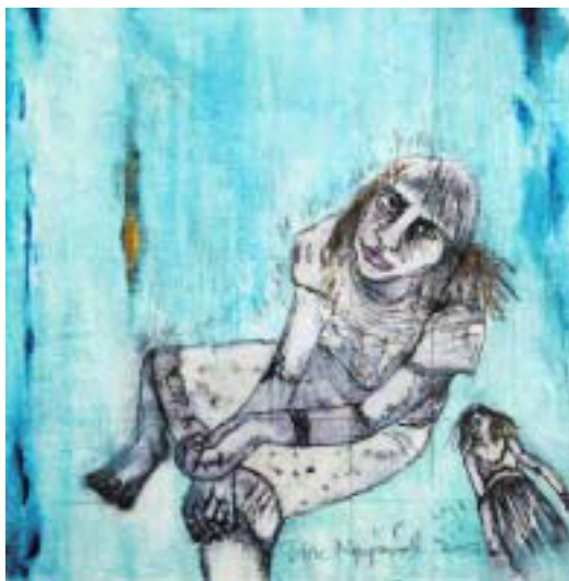
MALERI: «Styrkedager» er et av de mindre maleriene på utstillingen.