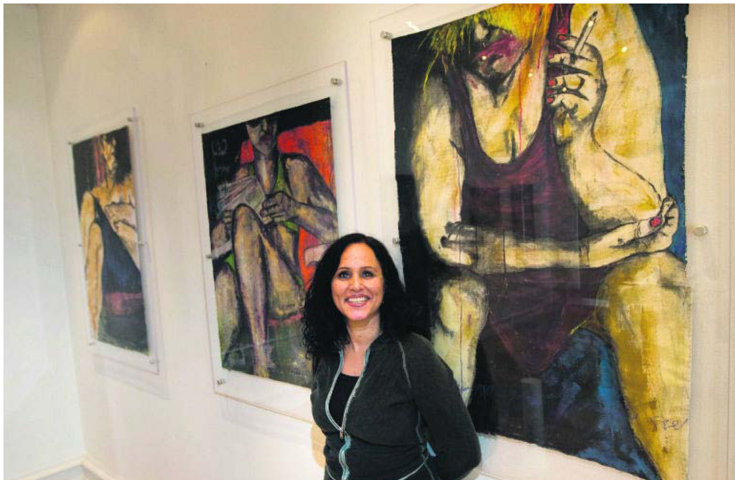
UTSTILLING: Tine Nygårds mennesker på stranden bærer preg av levd liv.