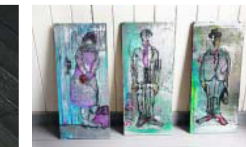
FYRFOLK: Tine Nygård lar seg fascinere av mennesker og historiene deres fra livet ved et fyr.