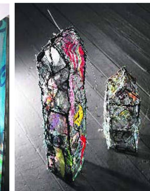
FYR: Tredimensjonale hus, opprinnelig tegnet og sydd på avispapir og siden blandet inn med silke.