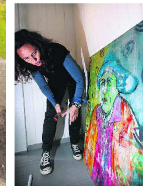
VERHARDT: Mann fra et værhardt miljø, slik Tine Nygård ser han.

► Utstillingen på Lindesnes fyr varer fra 14. juni til 16. august