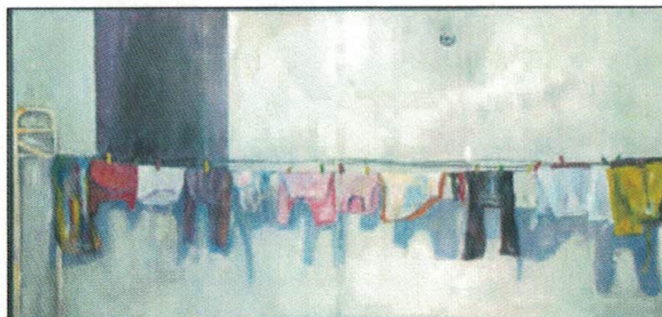
«Tørketid»: En snor med farger.

Offsetplatene slipes med fint sandpapir for å gi feste til både akrylmaling og tidvis, til pæsteltiftene. Der teksten fra trykkplatene kan arbeide sam-