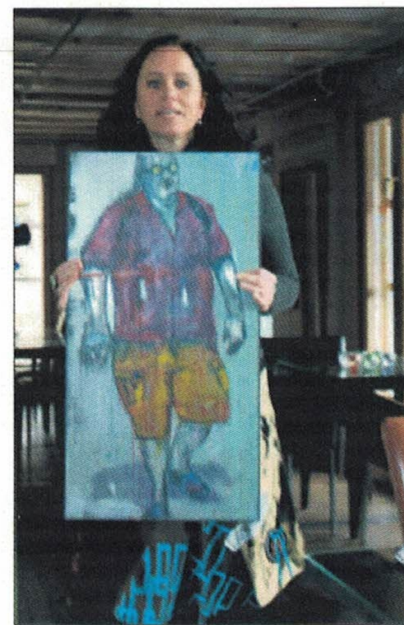
Ikke «Turistens klagen»: En eldre «back packer» på reise. Ikke av den mest ungdommelige sorten.